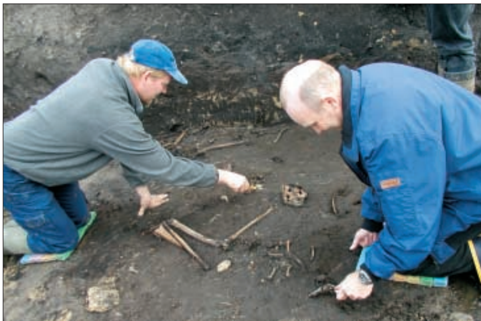
Aldersro-manden under udgravning. Skelet af en 40-50 år gammel mand fra jernalderen (300-200 f.Kr.) fundet i en mose