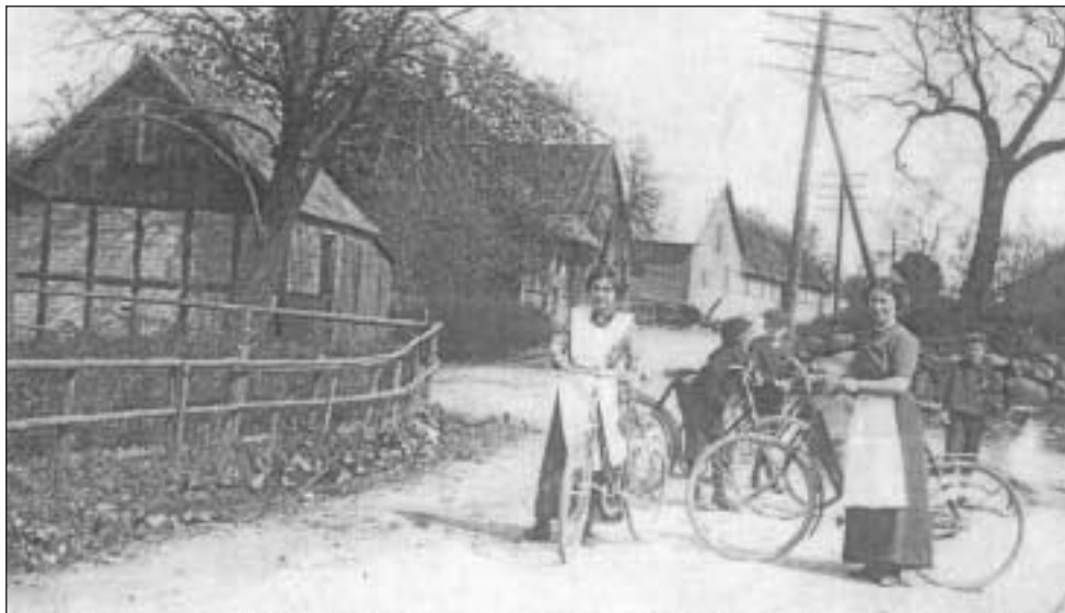
Købmanden i Elev, Høvej 3B

Stoffet til dette Indlæg er behandlet ultra kort, idet en fyldestgørende historie ville fylde mere end denne Bog.