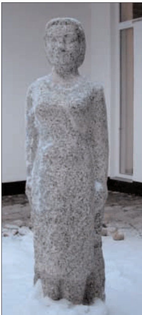
»Elstedpigen« ved Elsted Sognegård, skulptur af Aage Bruun Jespersen, Elsted