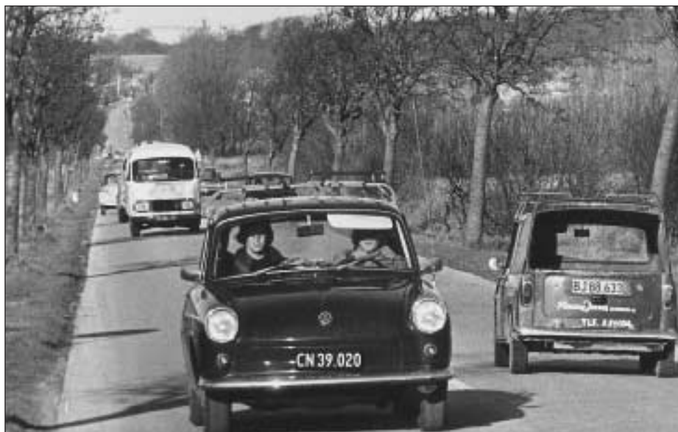
Lystrupvej i 1970'erne

Trafikudvalget mødes ca. seks gange årligt. Udvalgsmedlemmernes skriveborde er aldrig tomme, idet en sagsbehandling kan tage lang tid. Ofte må der stilles spørgsmål til Århus Kommunes Vejkontor for at få forklaringer, hjælp eller kopier af tidligere beslutninger.