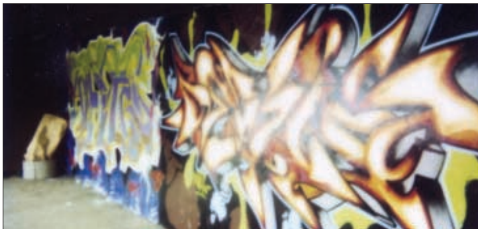
Unge-Projekt »tunneler i farver« 1998

byens højeste punkt. Vi vandrer gennem Sønderskoven op til skovens nordøstlige hjørne, hvor vi kommer ud på stien om til kirkens indgang. Vi står nu over for en af Danmarks moderne kirker, der har såvel kirkerum som mødelokaler og kirkekontor i en samhörighed, der føles helt naturligt. Kirken er bygget i 1989 og indviedes 1. søndag i advent samme år. Træd ind i kirkebygningen, ind i lyset under den af 4 søjler bårne lanterne. Oplev fornemmelsen af at være trådt ind i et Guds hus der ikke byder til ydmyg andægtighed, men stråler af åbenhed. Gå til venstre ind i kirkerummet og føl atmosfæren i det smukke rum, der stråler af imødekommethed, ikke at det byder til sagtmodig andagt, men til et frit sind, der åbent anerkender, at her gælder regler, der gør dig fri til at forrette din gudstjeneste i et lyst og venligt rum, der opløfter dit sind til samhörighed, godhed og medmenneskelighed. Fra kirken kan man se hen langs facaden til Lokalcenter Sønderskovhus, der er et moderne ældreplejecenter, der også betjener hjemmeboende ældre. Vi fortsætter ad stisystemet ned til et kryds,