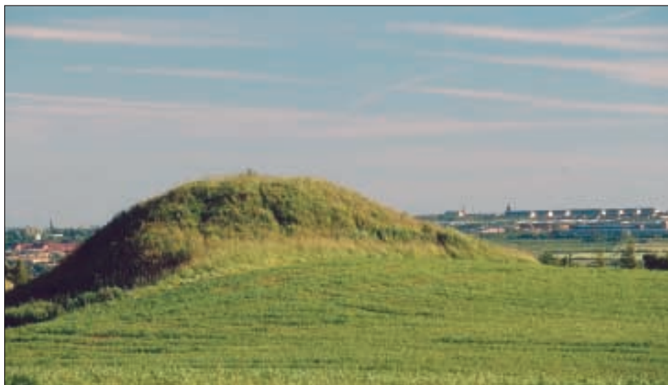
Blindemandshøj bag Elsted Præstegård