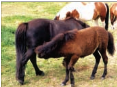
Heste på Byggeren

På lokalcentret Sønderskovhus er der mange aktiviteter for områdets ældre og