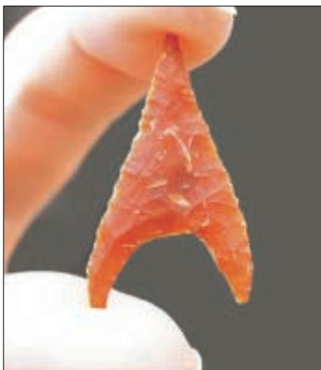
Omkring 4000 år gammel fladehugget pilespids af flint fra overgangen mellem stenalderen og bronzealderen

Århus Amt besluttede i 1997 at anlægge en motorvej nord om Århus fra Søften til Skødstrup. En strækning på 13,6 km. der skærer sig igennem mange vigtige fortidsminder. Fortidsminder, der endnu ikke kan ses, men alligevel rummer vigtige oplysninger om vores fælles kulturarv. På sin vej gennem landskabet skærer motorvejen 20 lokaliteter, der rummer så velbevarede og væsentlige fund, at de skal udgraves. Moesgård Museum udgraver fortidsminderne under den planlagte motorvej og udgravningerne forløber fra efteråret 2001 til efteråret 2003. Det sker i samarbejde med Århus Amt, som giver omkring 30 millioner kr. til det store projekt. Der er hele tiden fem udgravninger i gang på