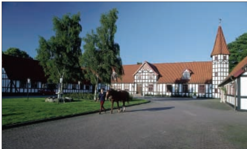
Skaarupgaard årets lokalitet 2001