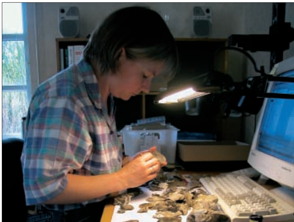
Sortering af flintfund på Moesgaard Museum, fra udgravningerne i Lystrup Enge